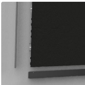
Finition par bordure design