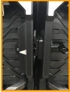
Curvable 3 positions: -5, 0,+5

Résistance, contraste élevé & installation simplifiée