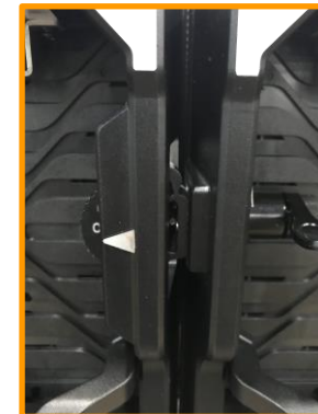
Curvable 3 positions: -5 / 0 / +5