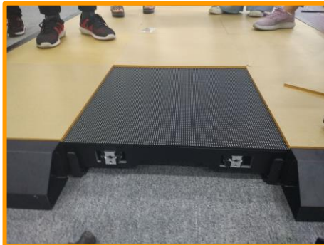
Option DanceFloor (avec cadre et piétement sur vérins)